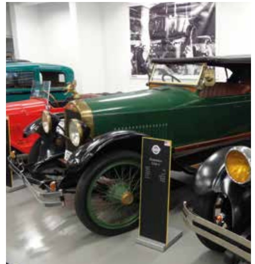
Die Auto Sammlung Steim ist ein Muss für jeden Automobilbegeisterten.

Sehr gerne sind auch Mitglieder aus der ganzen Sektion Thurgau willkommen.